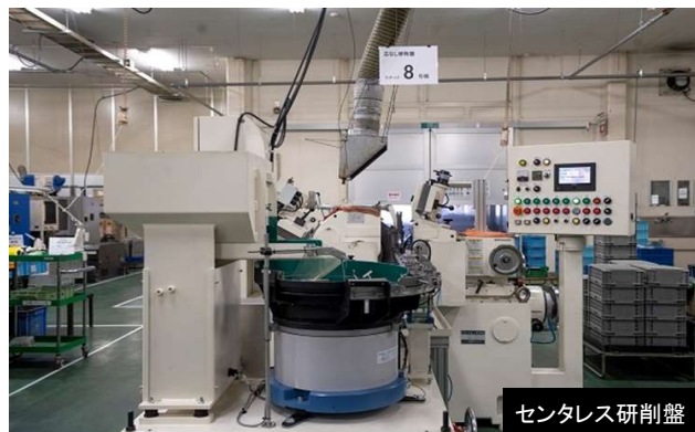
センタレス研削盤